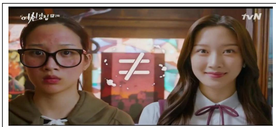
Imagem 01: Print de tela de “Beleza Verdadeira”